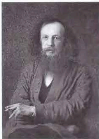
А. Д.И. Менделеев

20. Укажите русского писателя, который жил в XIX веке.