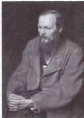
Б. Ф.М. Достоевский